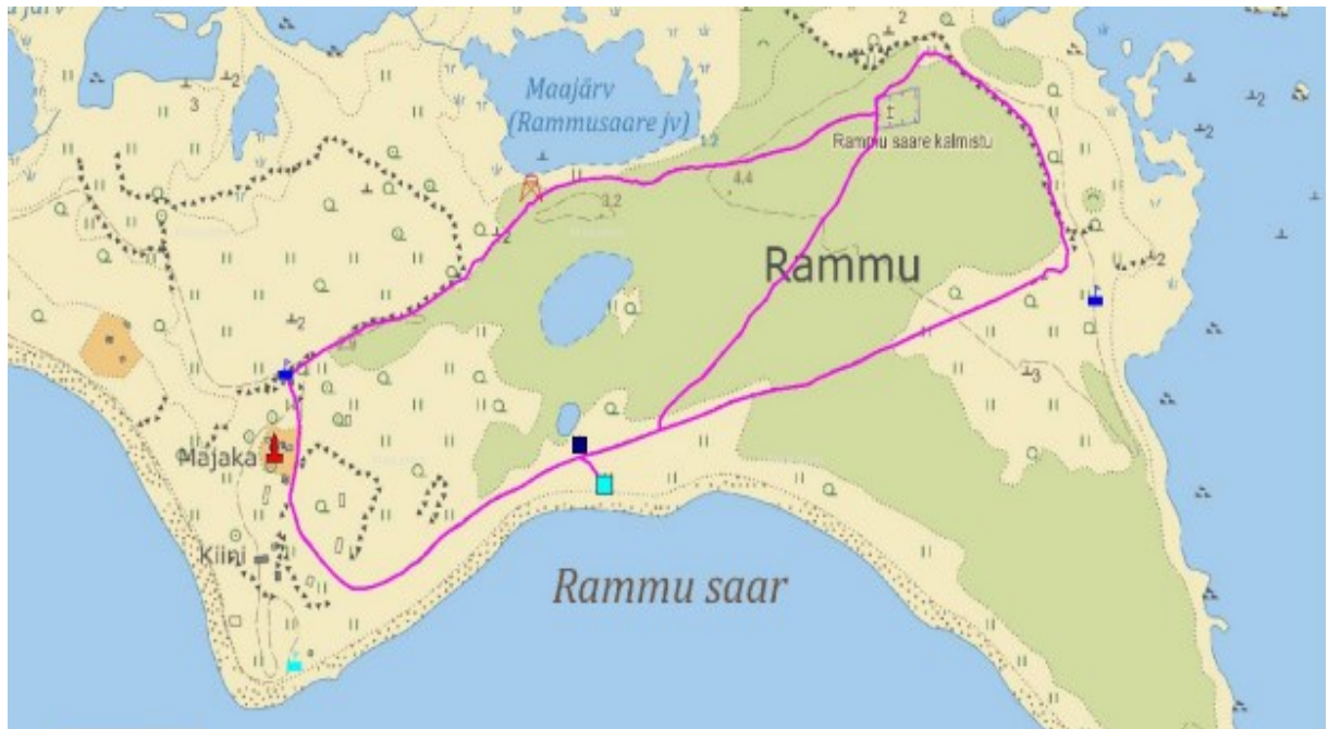
Joonis 1. Väljavõtte Kolga lahe loodus- ja linnuala kaitsekorralduskavast (2021-2030). Lilla joonega märgitud liikumisrada.

Kaitsealal on lubatud kaitseala valitseja nõusolekul jalgrattaga sõitmine teedel ja radadel . Sõidukiga ja maastikusõidukiga sõitmine on lubatud järelevalve- ja päästetöödel, kaitse-eeskirjaga lubatud töödel, sh metsatöödel, kaitseala valitsemise ja kaitse korraldamisega seotud tegevusel, kaitseala valitseja nõusolekul teostataval teadustegevusel ning liinirajatiste hooldustöödel 4 . Kaitseala valitseja kooskõlastab iga juhtumi korral sõidukiga sõitmise eraldi. Samuti on kaitseala valitsejal õigus jätta tegevus kooskõlastama, kui see võib kahjustada kaitse-eesmärgi saavutamist või seisundit 5 .